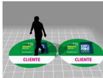
Imagem meramente ilustrativa. O logo "CLIENTE" sinaliza onde sua marca estará exposta.