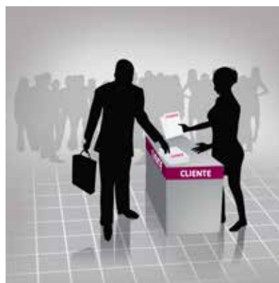
Imagem meramente ilustrativa. O logo "CLIENTE" sinaliza onde sua marca estará exposta.