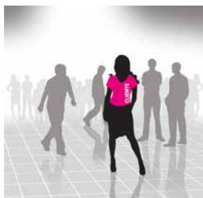
Imagem meramente ilustrativa. O logo "CLIENTE" sinaliza onde sua marca estará exposta.